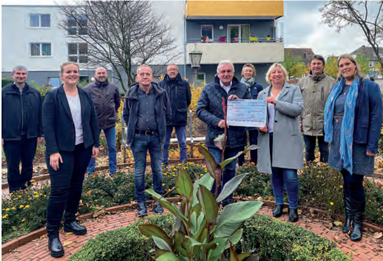
Scheckübergabe Anfang November 2021

Das Orgateam für „Jo-Jo“ plant zwei Treffen pro Jahr: Das zweite Wochenende im September; in den ungeraden Jahren findet Jo-Jo-Kultur mit einem ökumenischen Gottesdienst statt, und in den geraden Jahren eine Jo-Jo-Begegnung in der St. Josef Kirche. Im Frühjahr ist Jo-Jo-Begegnung in der Johan-