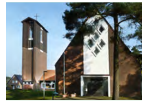
Trinitatis- kirche, Lingen Birkenallee 13

Sonntag, 13. Februar, 11.00 Uhr Gottesdienst – Pastor Meißner