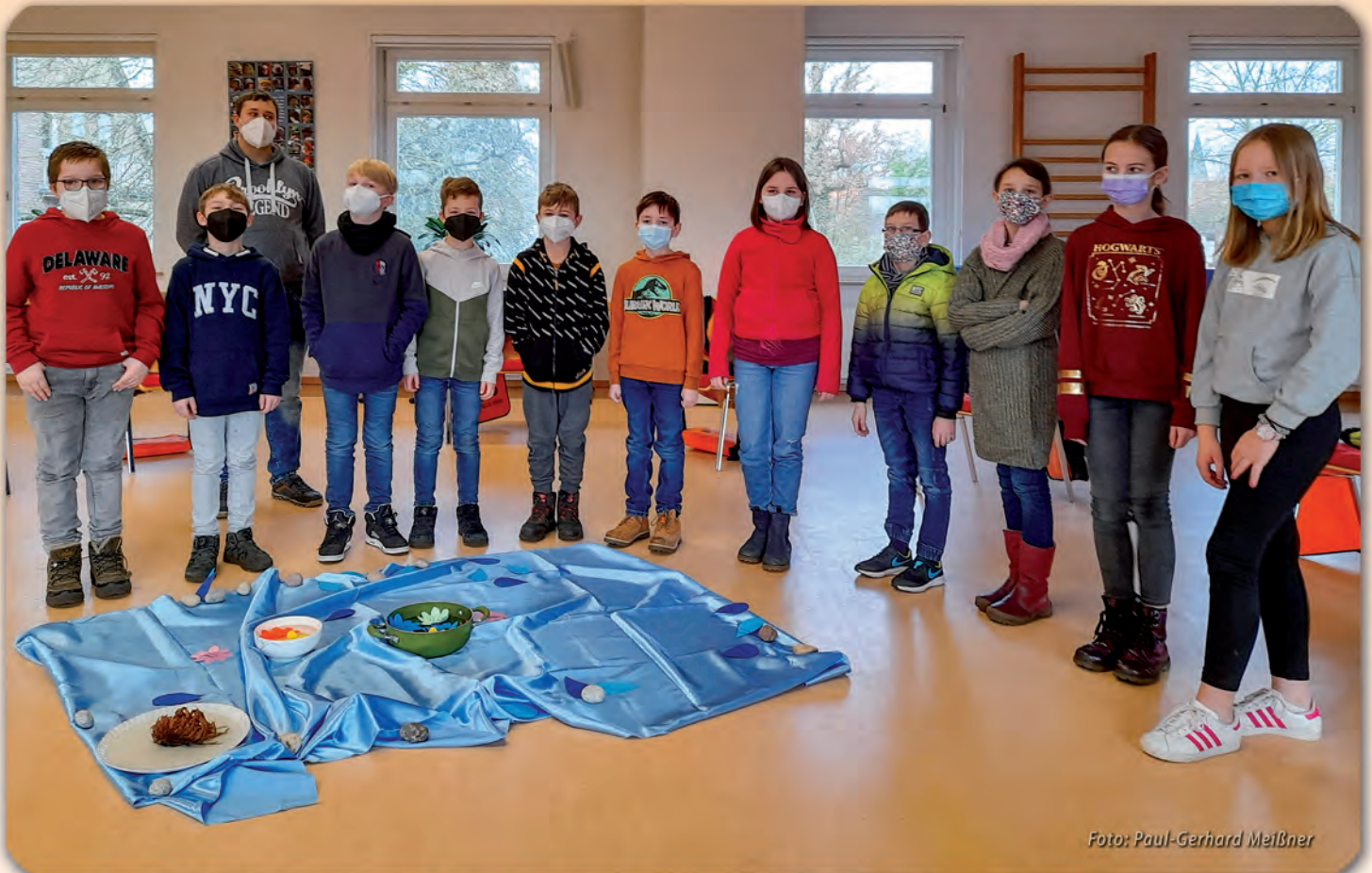
Die Konfi3 Kinder der Kreuzkirchengemeinde in Lingen beschäftigten sich zur Zeit mit dem Thema Taufe