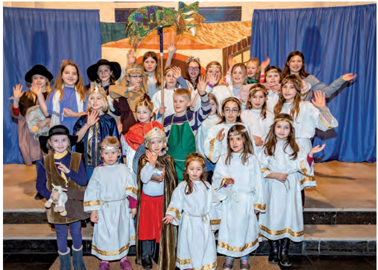
Krippenspiel an Heiligabend 2021