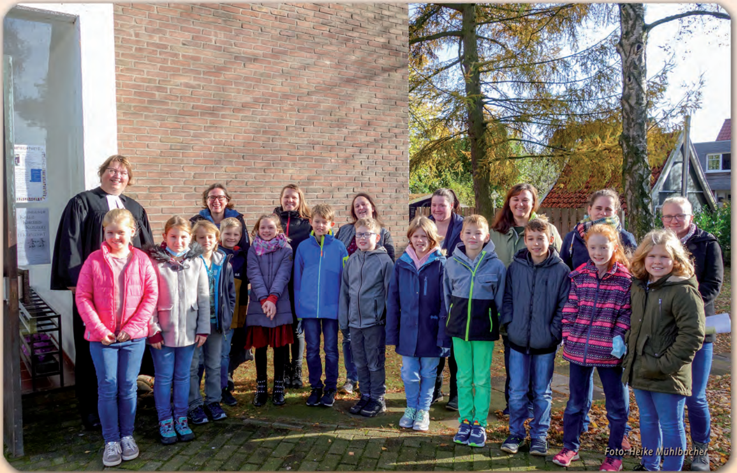
Begrüßungs-Gottesdienst der neuen Konfi3 Kinder der Trinitatiskirchengemeinde im November 2021