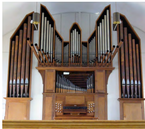
Die Flentrop-Orgel in der Kreuzkirche

Ca. 9.000,- Euro sind zusammengekommen und damit können Projekte unseres Gemeindelebens unterstützt werden: Die Gestaltung des Geländes hinter dem Kirchenzentrum