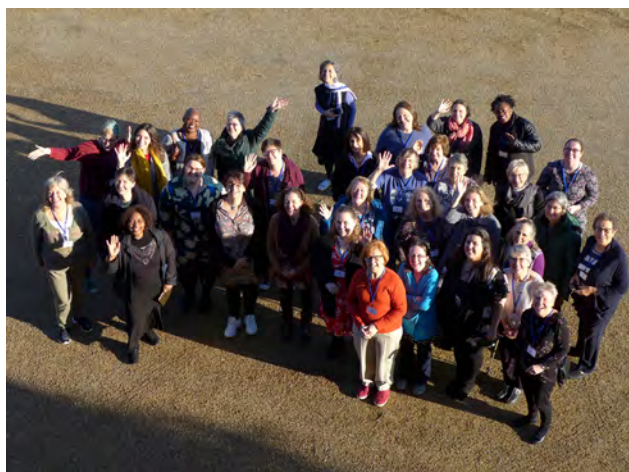
Die aktuellen Delegierten aus allen Erdteilen im Internationalen Weltgebetsstags-Komitee.

Der 4. März 1927 gilt als die Geburtsstunde des ersten gemeinsamen Weltgebetsstages von Frauen zahlreicher christlicher Konfessionen. WGT-Geschichte ist Weltgeschichte mit vielen bewegenden Momenten. Großes Aufsehen gab es z. B. 1943, als erstmals eine weiße und eine schwarze Frau gemeinsam eine Gebetsordnung schrieben – ein starkes Zeichen gegen den grassierenden Rassismus in den USA. Die erschütternden Erfahrungen beider Weltkriege verstärkten die Anstrengungen um gemeinsame Friedensarbeit und Partnerschaft. In Deutschland feierten Frauen 1949 ihren ersten WGT. Nach der Teilung gründete sich 1975 sogar in der DDR ein eigenes Komitee. 19 Jahre später verschmolzen die Ost- und Westkomitees zu einem. Seit 2003 ist der „Weltgebetsstag der Frauen – Deutsches Komitee e. V.“ ein eigener Verein*. Weltweit sind die einzelnen Komitees in einem internationalen mit delegierten Frauen aus allen Erdteilen organisiert.