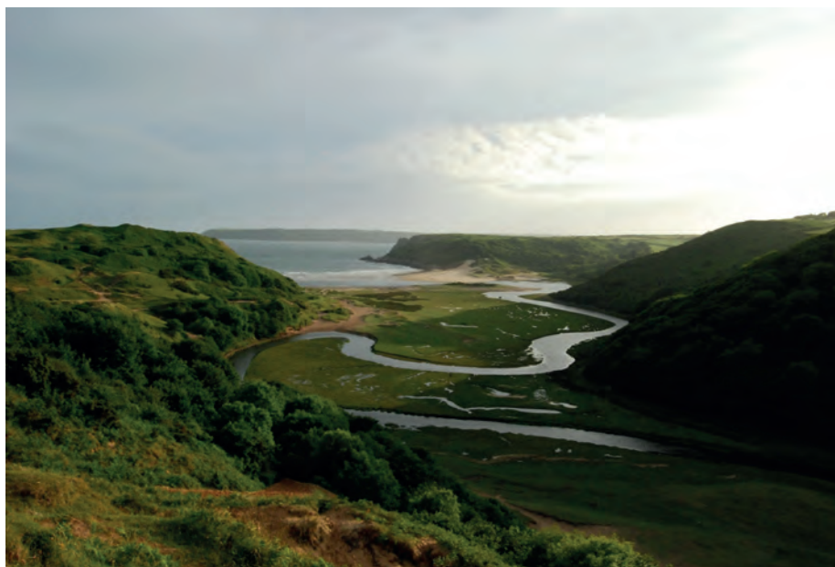
Neben pulsierenden Großstädten laden die wunderschönen Landschaften von England, Wales und Nordirland anlässlich des WGT 2022 zum Kennenlernen ein.