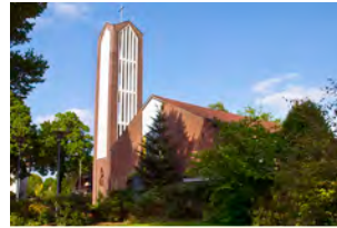
Johanneskirche Schützenstraße 11 Lingen

Sonntag, 24. April, 11.15 Uhr Gottesdienst in Brögbern – Prädikant Noetzel