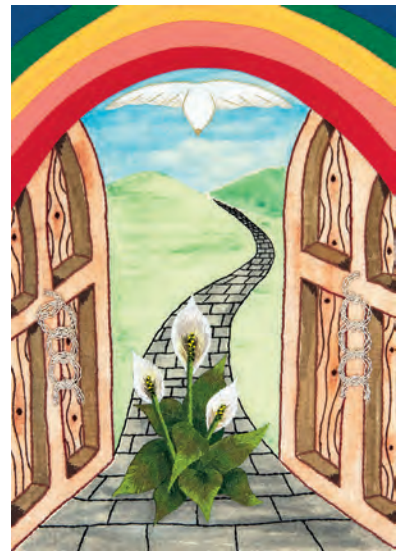
Bild zum Weltgebetstag mit dem Titel "I Know the Plans I Have for You" von der Künstlerin Angie Fox

Jeder Gottesdienstbesucher sollte seine Adresse und Telefonnummer auf einem Zettel vermerken, der im Eingangsbereich abzugeben ist. Für alle Frauen, die vielleicht nicht am Präsenzgottesdienst teilnehmen können, besteht die Möglichkeit sich den Weltgebetstag Gottesdienst im TV oder online anzusehen. Der Fernsehsender Bibel TV zeigt am Freitag, den 04. März 2022 um 19 Uhr einen Gottesdienst zum Weltgebetstag. Das gleiche Video wird es außerdem den ganzen Tag auf youtube und auf www.weltgebetstag.de geben. Ebenfalls besteht die Möglichkeit die Kollekten Spende an folgende Bankverbindung zu überweisen: Weltgebetstag der Frauen – Deutsches Komitee e.V., Ev. Bank eG, Kassel IBAN: DE60 5206 0410 0004 0045 40, BIC:GENODEF1EK1