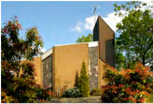
Christuskirche Sandbrinkerheidestraße 32 Brögbern

Sonntag, 13. Februar, 11.15 Uhr Gottesdienst zur Taferinnerung für Konfi3 in Brögbern – Pastor Mühlbacher