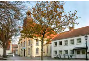
Kreuzkirche Universitäts- platz 1, Lingen