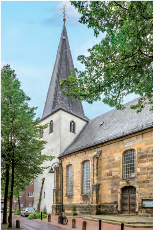
Reformierte Kirche in Lingen