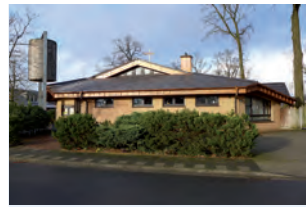
Kirchen- zentrum Lohne Friedensweg 3