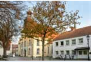
Kreuzkirche Universitäts- platz 1, Lingen