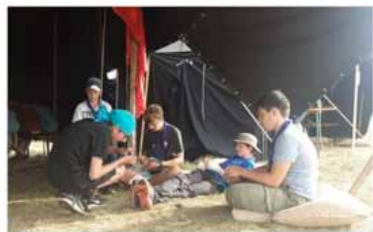
In den Cafés konnte man gut die Zeit verbringen. Es gab Kakao, Waffeln und sogar Veggie-Döner.