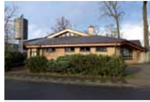
Kirchen- zentrum Lohne Friedensweg 3