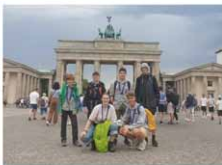
Mit dem 9-Euro-Ticket haben wir einen Ausflug nach Berlin gemacht.