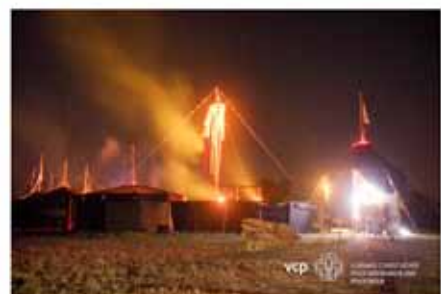
In den vier Oasen wurden die Abende lang.

Einen vollständigen Bericht über das Bundeslager findest du auf unserer Website vcplingen.de !