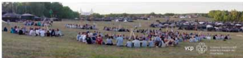
Bei dem internationalen Abend konnte man viele Pfadfinder aus der ganzen Welt kennenlernen, bei deren Liedern mitsingen und bei deren Bräuchen mitmachen.