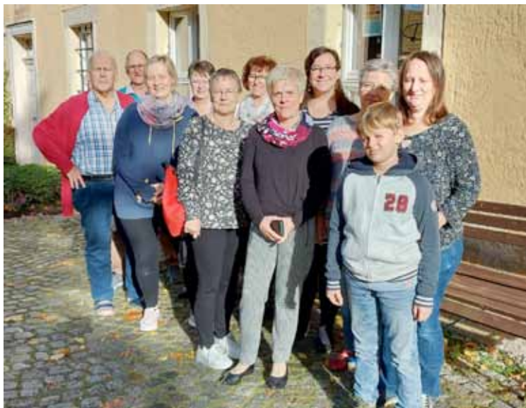
Eine Delegation aus Lingen zu Besuch im Neuhausen.

Um 13.30 Uhr begann bei gutem Wetter der Festumzug. Auf einem festlich geschmücktem Wagen wurden die Glocken durch die Gemeinde zur Kirche in Neu-