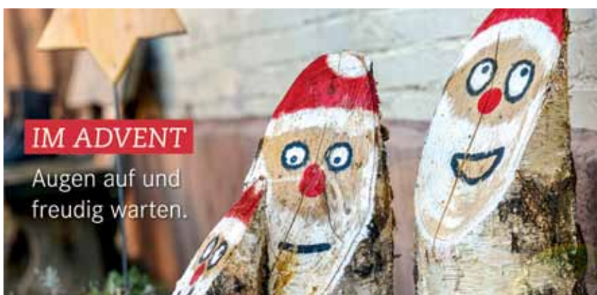
Grafik, Foto: gemeindebrief.evangelisch.de

Die Gottesdienste finden in der Zeit vom 08. Januar bis 26. März im Gemeindehaus statt