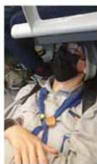
Hunderte andere Pfadis mit uns im Zug.