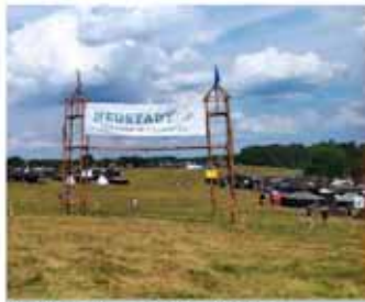
Das Lagertor vom Bundeslager: Neustadt – du hast die Wahl!