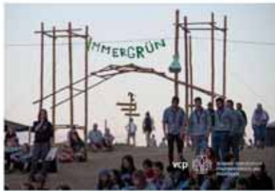
Einmal grün, IMMERGRÜN – unser Teillager.