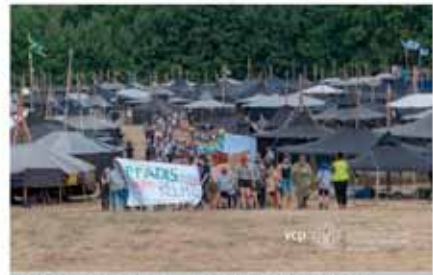
Große Demonstration auf dem Bundeslager: Pfadis gegen rechts.