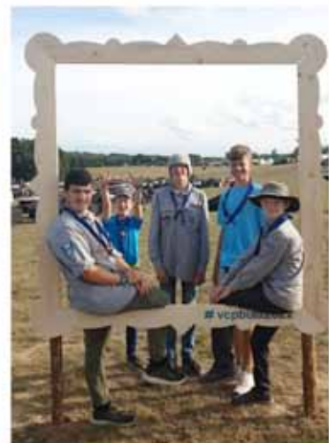
Unter dem Hashtag #vcpbula2022 findet man auf Instagram viele weitere Eindrücke.