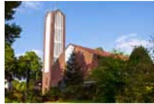
Johanneskirche Schützenstraße 11 Lingen

Winterkirche in Biene - Die Gottesdienste finden in der Zeit vom 08. Januar bis 26. März ausschließlich in der Auferstehungskapelle (Martin-Luther-Str. 2) statt