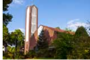
Johanneskirche Schützenstraße 11 Lingen

Samstag, 31. Dezember, 17.00 Uhr Altjahrsabend Jahresschlussgottesdienst in der Kreuzkirche - Pastor Meißner