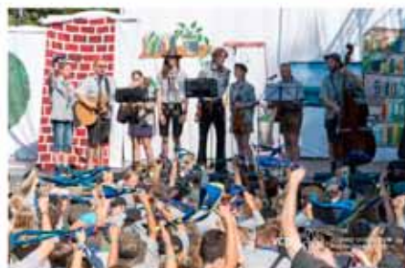
"Lang war die Reise..." – Natürlich wurde auf dem Bundeslager viel gesungen.