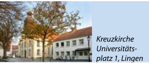
Kreuzkirche Universitäts- platz 1, Lingen