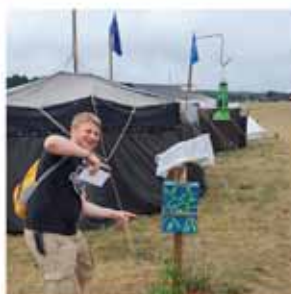
Die Lagerpost – so entstanden witzige Bekanntschaften.